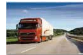
Protection et Expédition de médicaments thermosensibles