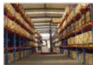
Logistique Santé Humaine et Animale